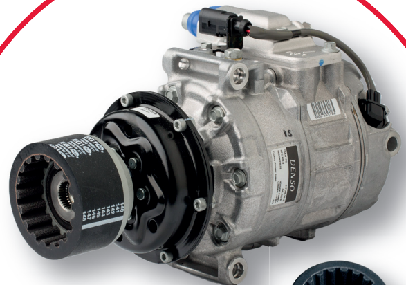
Original Kompressor mit Original Kupplungssatz (OE Ref.: 070 903 201 E / 070 903 327 D)